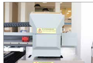
Cabeça de Impressão Epson