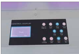
Painel de operações