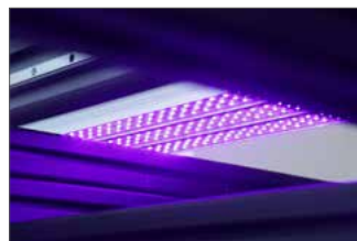
Ponte com luz de LED