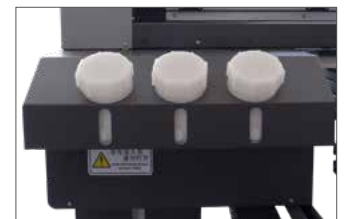
Reservatório de Tintas